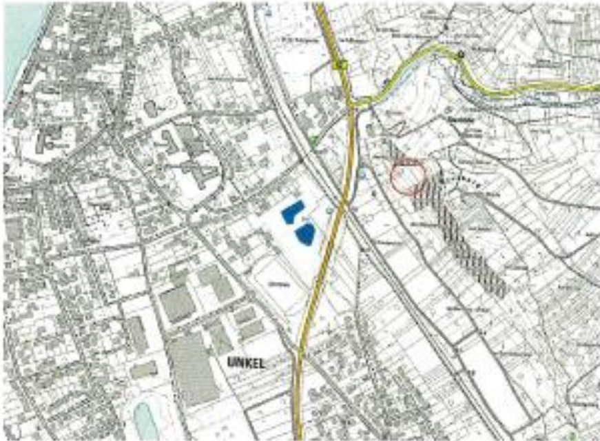
Abb. 1: Lage der instabilen Trockenmauern östlich von Unkel (roter Kreis).

Nach Auskunft des Winzers sind die Schäden an der Mauer nach den starken Niederschlägen im Winterhalbjahr aufgetreten. Die Mauern in diesem Abschnitt des Stuxbergs zeigten in der Vergangenheit immer wieder Anzeichen für Instabilitäten. Zur Sanierung der beiden Schadenstellen lag bereits ein Angebot einer Garten- und Landschaftsbaufirma vor.