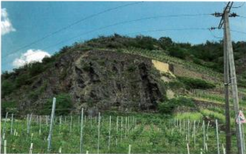
Abb. 2: Schadenstelle am Stuxberg mit eingestürzter Trockenmauer.